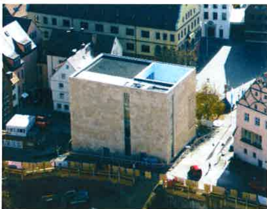
Neue Synagoge Ulm (Luftbild)