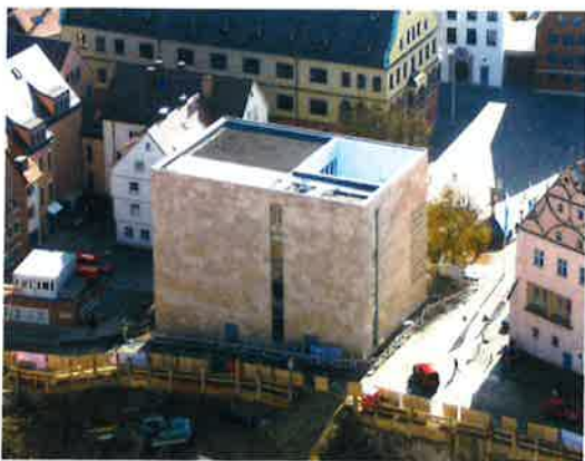
Neue Synagoge Ulm (Luftbild)