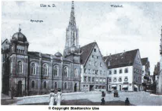
Postkarte der Alten Synagoge Ulm

(Fast am selben Platz, im Hintergrund Ulmer Münster)